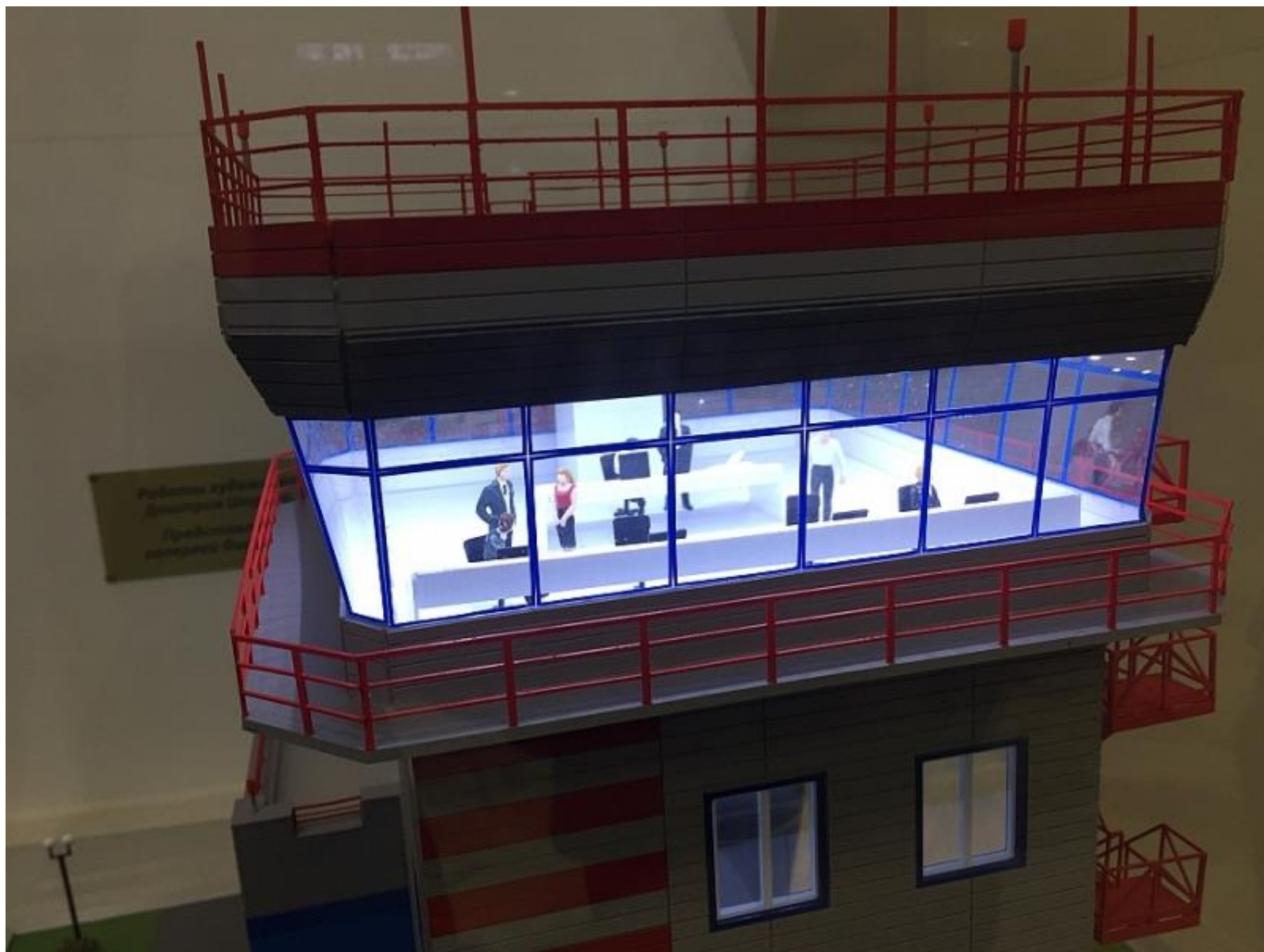
Макет высокой детализации, даже можно увидеть диспетчера за работой.