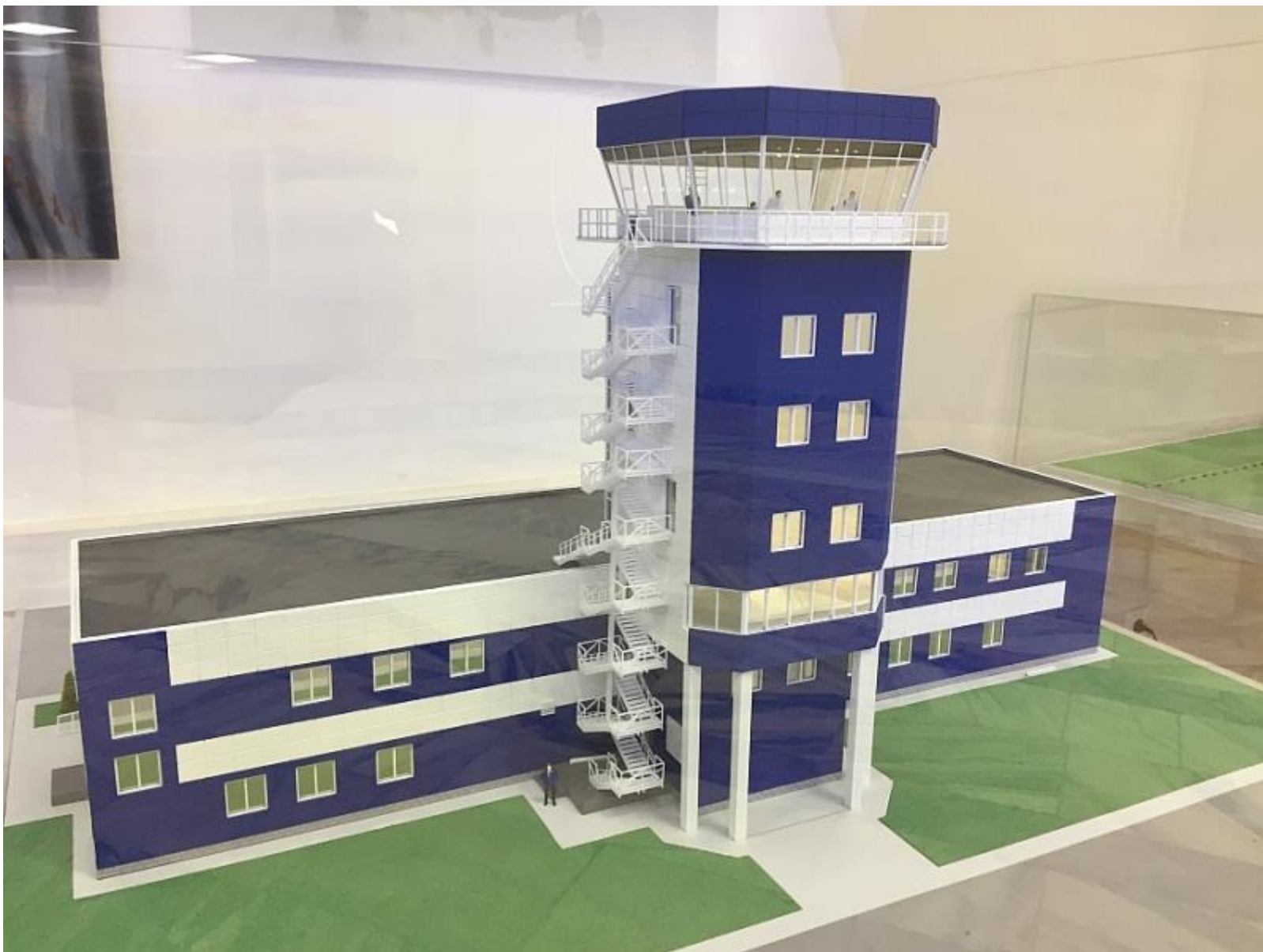
Макет филиала «Камчатэронавигация». Построен и введен в эксплуатацию.