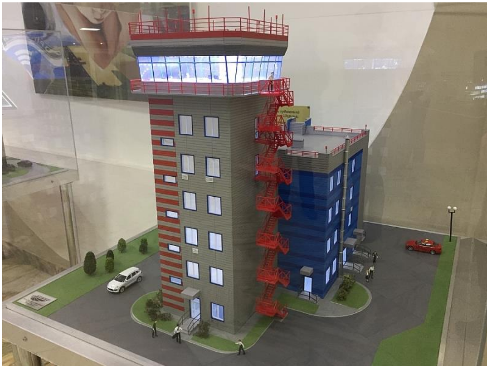
Командно-диспетчерский пункт аэропорта «Благовещенск».