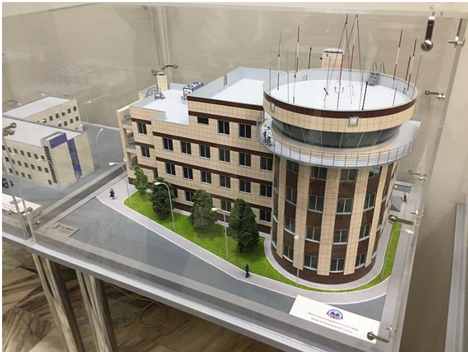
Калининградский РЦ ЕС ОрВД – обособленный проект в контексте строительства укрупненных центров.