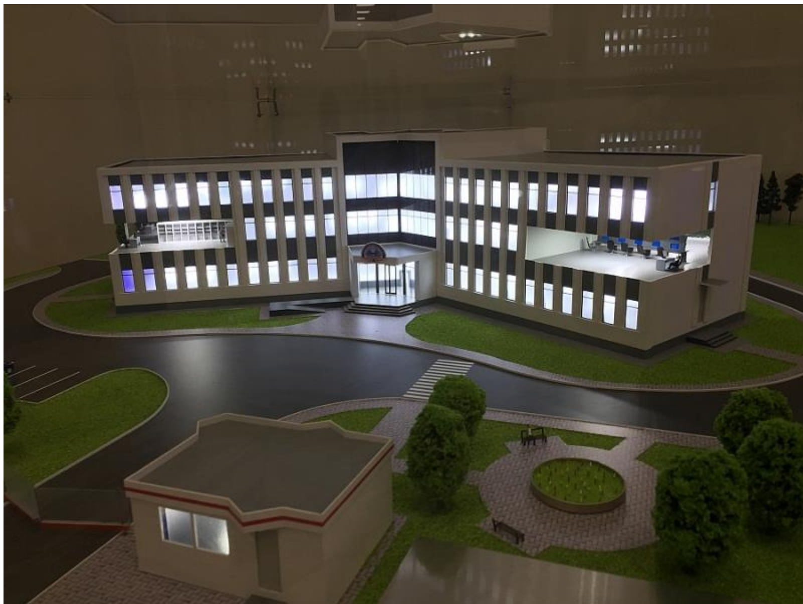
Тюменский укрупненный центр Единой Системы ОрВД. Введен в эксплуатацию в октябре 2019 года.