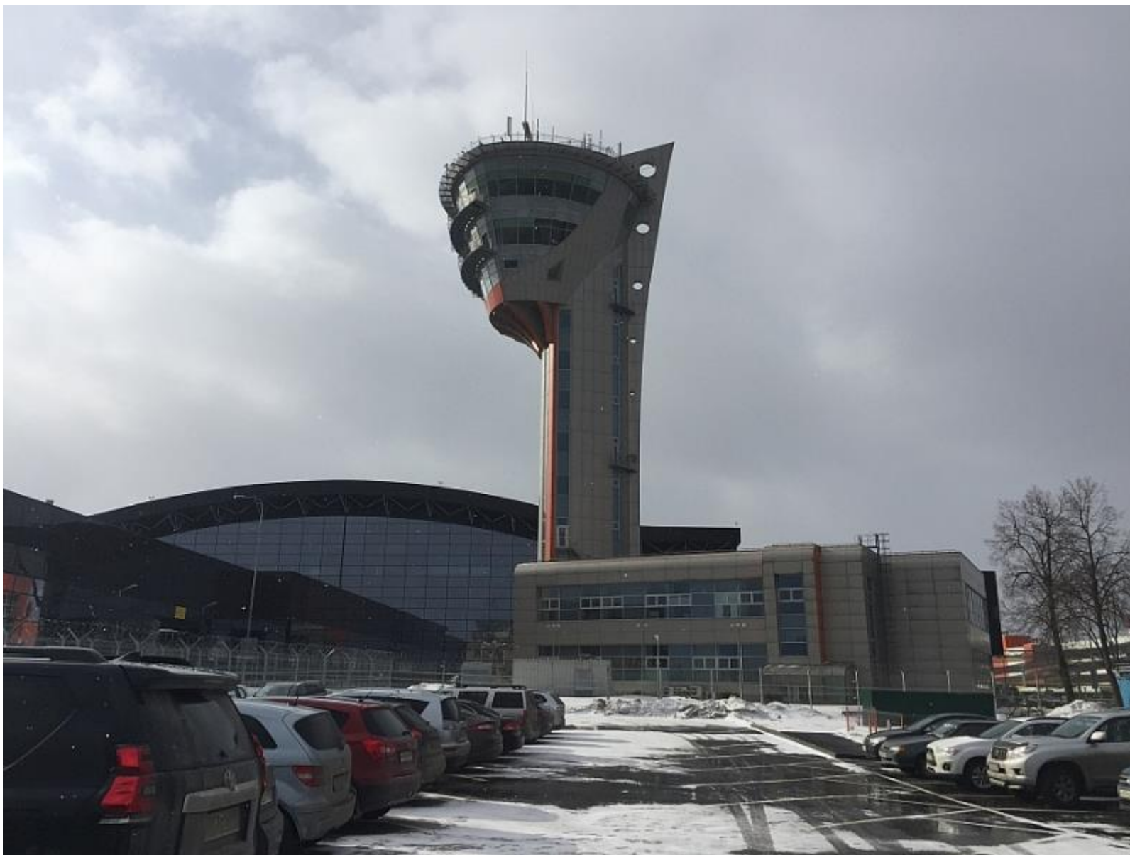
Шереметьевская вышка КДП была введенная в эксплуатацию в 2013 году.