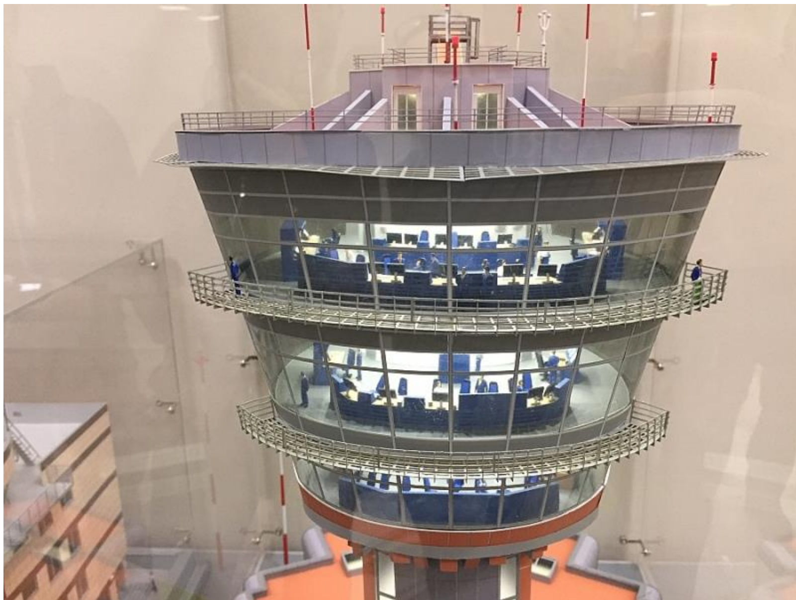
Макет высокой детализации, вплоть до эмоций людей на вышке.