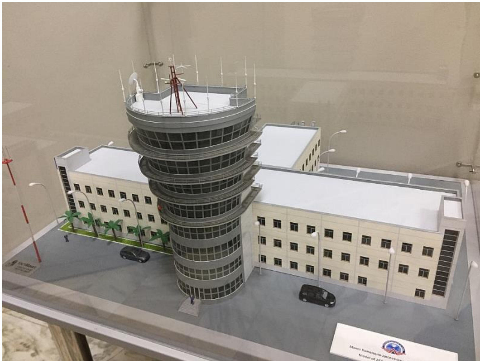
Командно-диспетчерский пункт аэропорта «Сочи». С этой вышки обслуживалось интенсивное воздушное движение во время Олимпиады-2014.