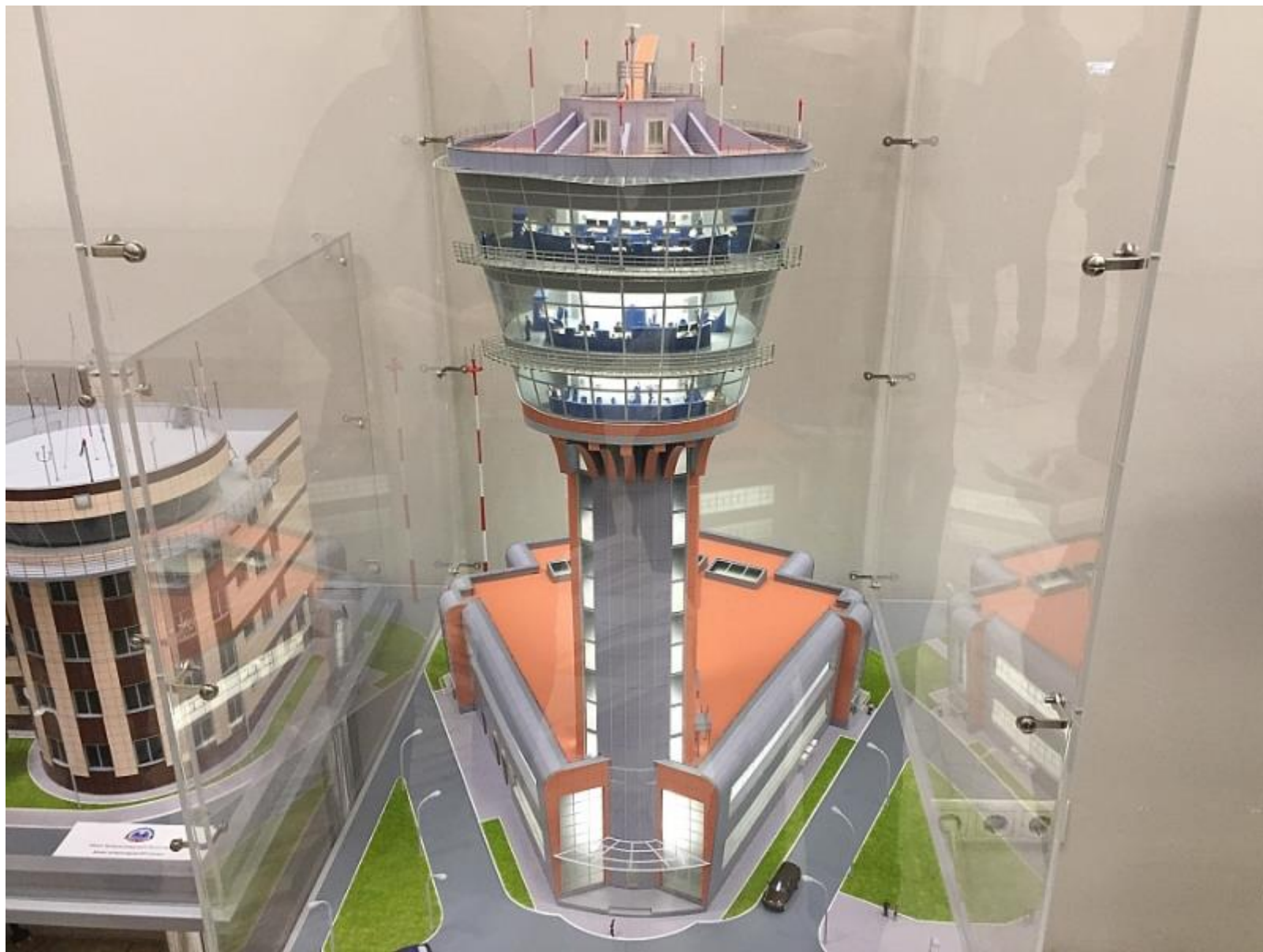
Макет Командно-диспетчерского пункта аэропорта «Шереметьево».