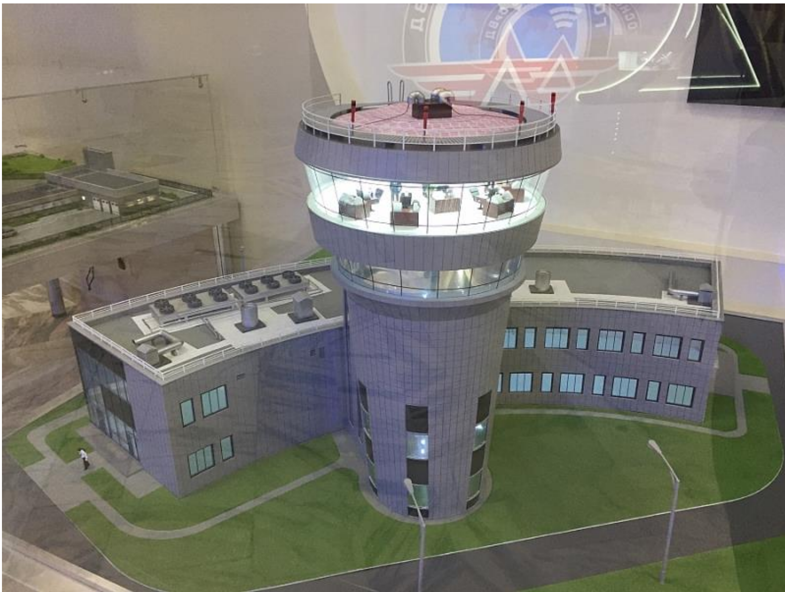
Командно-диспетчерский пункт аэропорта «Белгород».